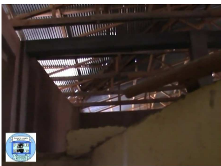
immagini della nuova ala in costruzione

Continua l'attività della costruzione del 2° piano dell'Ospedale. Obiettivo: a completamento dell'opera compreso arredi e servizi la potenzialità di ricoveri dell'Ospedale sarà raddoppiata.