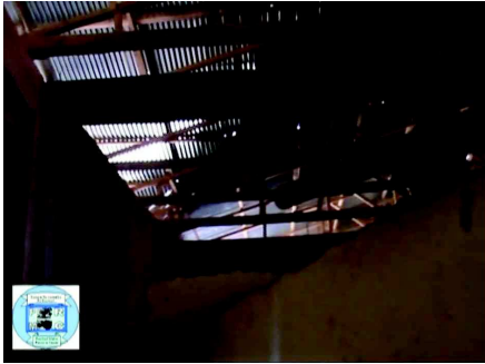
immagini della nuova ala in costruzione

Continua l'attività della costruzione del 2° piano dell'Ospedale. Obiettivo: a completamento dell'opera compreso arredi e servizi la potenzialità di ricoveri dell'Ospedale sarà raddoppiata.