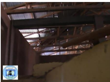
immagini della nuova ala in costruzione

Continua l'attività di costruzione del 2 piano dell'Ospedale Obiettivo : a completamento dell'opera compreso arredi e servizi la potenzialità di ricoveri, dell'Ospedale sarà raddoppiata.