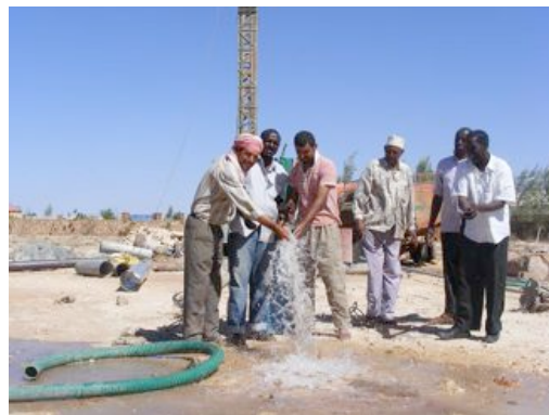
Il pozzo funzionante