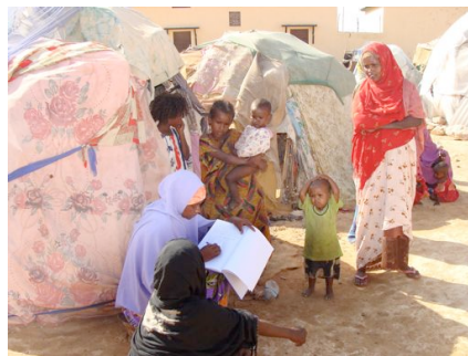
Un IDPs campo

Obiettivo specifico: fornire servizi sanitari essenziali alle popolazioni sfollate.