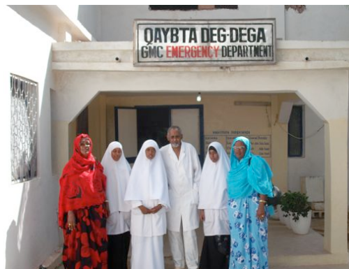
Ingresso emergenza ostetrica GMC

Realizzato un servizio di emergenza ostetrica nei campi: nei casi non risolvibili nei campi si è provveduto al trasporto utilizzando il Bus caravan dato in comodato dal GMC.